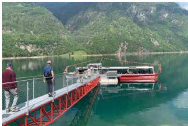
Die TCS Regionalgruppe Frauenfeld besuchte nach Pfingsten das Puschlav.

Am Donnerstagmorgen erwartet uns eine interessante Stadtführung in Poschiavo. Nach einer Überschwemmung im Jahr 1987 wurden alle Strassen der Innenstadt gepflastert. Im spanischen Viertel können wir einige Palazzi mit versenkbaren Fensterläden und gefälschten Fenstern bewundern. Auf der Palazzi Patissière, mitten in der Stadt, gibt es sogar noch einen Ziehbrunnen. Etwas ganz Besonderes besuchen wir im Hotel Albrici: Den original Sybillensaal aus dem 17. Jahrhundert. Zum Schluss können wir noch das älteste Haus bewundern, das Casa Tomé von 1357. Dann