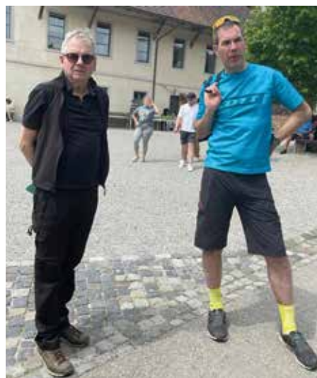
Die TCS-Regionalgruppe Weinfelden führte bei bestem Wetter ihren E-Bike Ausflug durch.

abgesondert als Einsiedler. Sie waren nicht sonderlich beliebt. Der Ittinger Sturm, mit der Zerstörung der Kartause Ittingen im Jahr 1524, war eine Fehde zu Beginn der Reformationszeit in der Schweiz und ein Vorbote der allgemeinen Bauernunruhen. 1848 wurden alle Klöster im Thurgau aufgehoben und die Mönche mussten gehen. Fasziniert von der Geschichte dieses heutigen Hotels mit Restaurant, Seminarmöglichkeiten, eigenem Gutsbetrieb, Museen und traumhaften Gärten, hätten wir Franz Isenring noch Stunden zuhören mögen. Die Rückfahrt führt hinunter nach Frauenfeld und mit Gegenwind in flotter Fahrt das Thurtal hinauf. Der Regen in den letzten Tagen und das