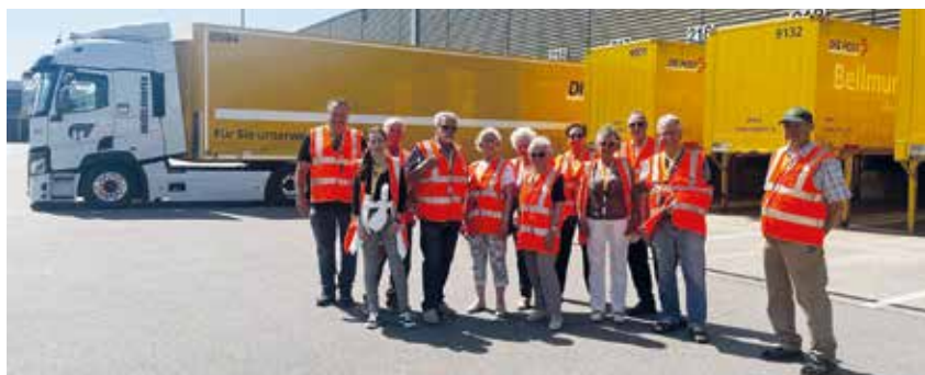
Spannende Einblicke in die Paketpost Frauenfeld.