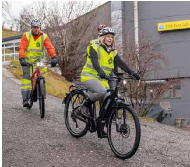
E-Bikes erfreuen sich immer höherer Beliebtheit.

Die Tests des TCS zeigen, dass bei Motoren von Elektrofahrrädern die ersten technischen Probleme entweder im ersten Jahr oder nach 4 bis 6 Jahren auftreten. Es sollte darauf geachtet werden, dass sich der Akku leicht herausnehmen und befestigen lässt und dass die Anschlüsse nicht verbogen oder verrostet sind. Die Hersteller geben eine Lebensdauer von 500 bis 1'000 Ladezyklen an. Ein Akku kann jedoch pro Jahr bis zu 5 % seiner