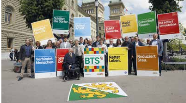
Delegation des Petitionskomitees in Bern bei der Übergabe der Petition für die rasche Umsetzung der BTS