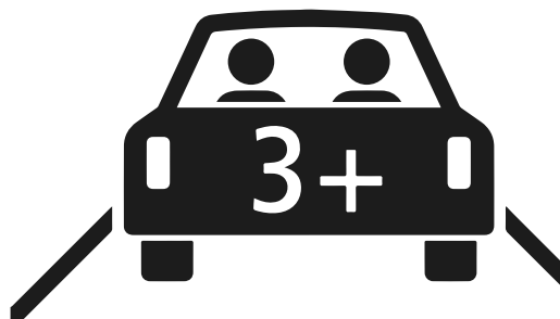
Das neue Verkehrsschild für Carpooling-Spuren.

2023 treten diverse Neuerungen im Strassenverkehr in Kraft. Am 1. Januar treten das Veloweggesetz und ein einfacheres Verfahren bei der Einführung von Tempo 30-Zonen in Kraft. Gleichzeitig gelten ab Neujahr Anpassungen bei Arbeitsmotorwagen und eine verbesserte Partikel-Messung bei Dieselfahrzeugen. Am 1. April treten diverse Anpassungen bei den Führerausweissvorschriften in Kraft.