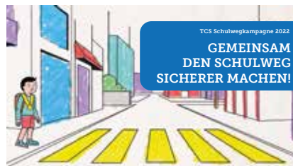
Aktion «Lueg für zwei»

Titelbild: Steckborn plant die Förderung des Langsamverkehrs und klärt die Temporeduktion auf 30km/h ab.