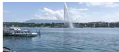
Delegiertenversammlung in Genf