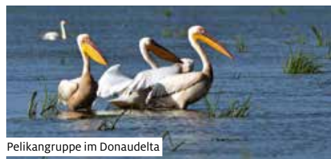
Pelikangruppe im Donaodelta