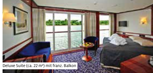
Deluxe Suite (ca. 22 m 2 ) mit franz. Balkon