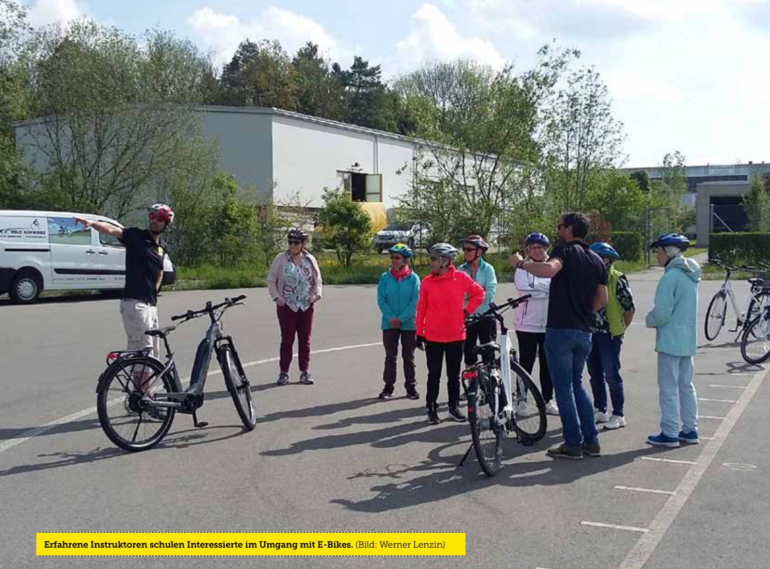
Erfahrene Instrukturen schulen Interessierte im Umgang mit E-Bikes.